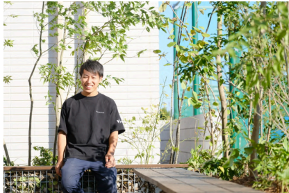
WOODSMART / ウッズマート

「植木の魅力で、より豊かな暮らしを目指して」を理念に、グリーンコーディネーターやランドスケープデザイナーとして活動。オープンスペースや商業施設、ホテル等のあらゆる場所を対象に、グリーン（植木）を軸とした空間の設計施工を得意とする。グリーンインフラ大賞国土交通大臣賞、GOOD DESIGN賞、都市緑化機構会長賞などの受賞経歴。株式会社BIOTA、Green Neighbors合同会社、一般社団法人ドコモモヒロバのパートナー。