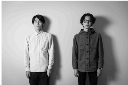
Vegetable Record / ベジタブルレコード

会期：2023年6月26日（月）～6月28日（水）9:00～21:00 ※ 26日のみ12:00オープン、28日のみ20:00クローズの予定です 協力：河原園